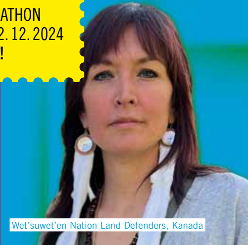
Wet'suwet'en Nation Land Defenders, Kanada