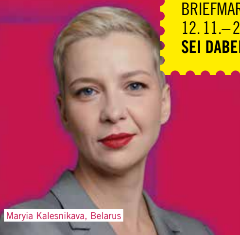
Maryia Kalesnikava, Belarus