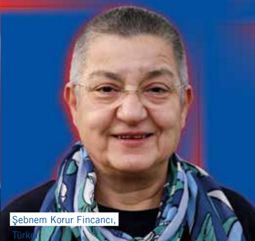
Şebnem Korur Fincancı, Türkei